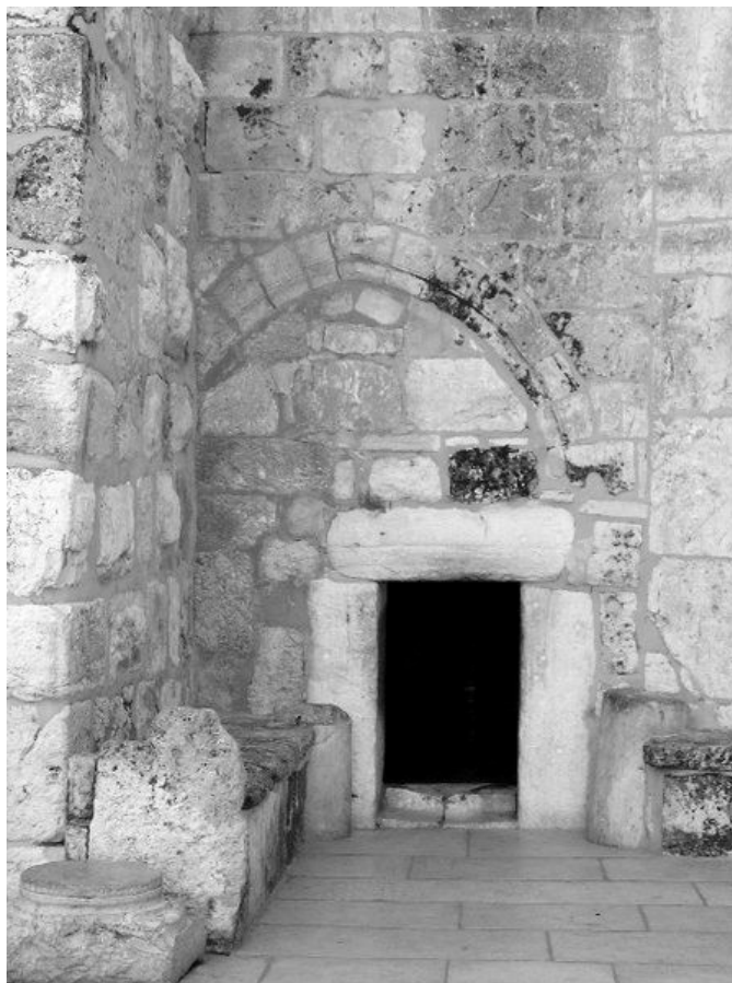
Wejście do Bazyliki Narodzenia w Betlejem.

Zwyczajowo w święto Trzech Króli na drzwiach wejściowych w wielu domach, kredą poświęconą podczas mszy odprawia-